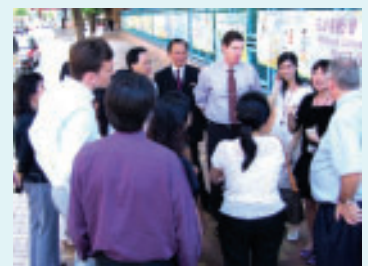
▲ 大廈管理公司職員向員工介紹辦公大廈之火警疏散安排。

助。經人數核實後，大廈管理公司職員向在場員工介紹整座辦公大廈之火警疏散安排，員工亦藉此機會檢討整過火警演習之過程，並向大廈管理公司有關人士建議在逃生樓梯當眼處，增加適當之常設逃生方向指示，使逃生人士能夠較清楚知道逃生方向。