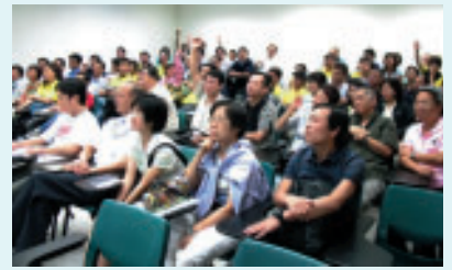
▲ 職安健大使踴躍發問。

淺速及神智不清等情況。處理的方法可分為直接及間接壓法，假若傷口不大，可以直接用敷料或用乾淨的衣服緊壓著出血的部位；如傷口過大，無法壓著止血時，可以採用止血帶止血法或用間接壓法在出血點與心臟間的動脈施壓以減少血液通過，但要注意每施壓15分鐘，須放鬆5分鐘。