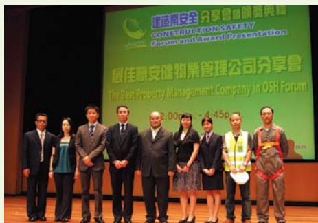
▲ 表演前來一張大合照。

經過各方的努力，令公司的整體職安健表現得以進一步改善，並於比賽中獲得季軍殊榮，在未來的日子，大使團隊仍然會繼續努力提升物業管理行業的職安健水平。