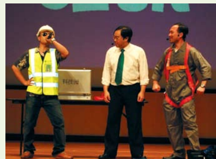
▲ 表演內容生動有趣。