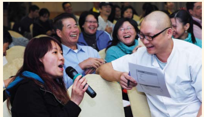
▲ 大使踴躍提問及發言。