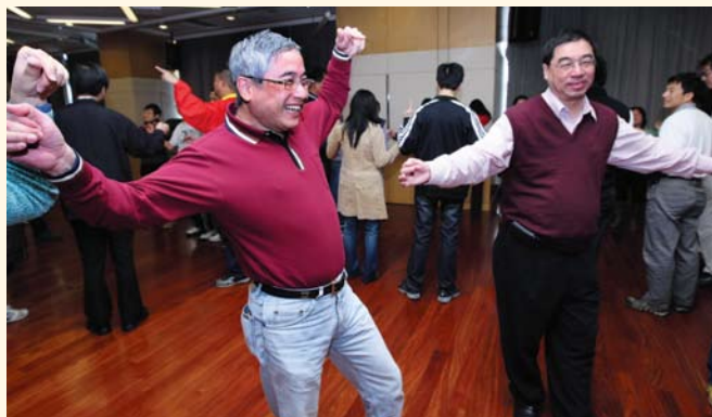
▲ 透過遊戲加強大使之間的認識。

講者取得與會者的注意後，便開始入正題，傳遞主題訊息。講者可採用「3P」的技巧來傳遞職安健訊息。所謂「3P」，是指目的(Purpose)，過程(Process)及得益(Payoff)。講者要讓與會者清楚了解指導的目的及相關訊息，然後讓他們清楚知道整個指導所採用的形式、流程及所需時間，最後是讓與會者明白參與該指導後會有甚麼得益。