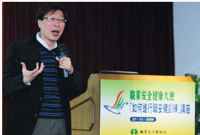
▲ 導師生動地講解進行職安健訓練及指導時應注意的要點。